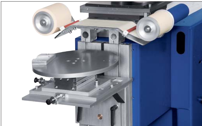
TPX 201 mit Maschinensockel MS 252, Verschiebetisch VTP 400, Tamponreinigung TAC und Koordinatentisch KT 30 TPX 201 on the machine base MS 252 with the shuttle table VTP 400, pad cleaning device TAC and coordinate table KT 30