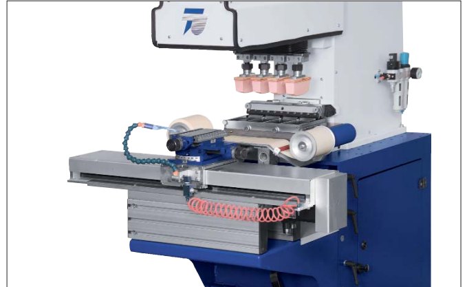
Pendeltisch PT 300 und Tamponreinigung TAC an TPX 201