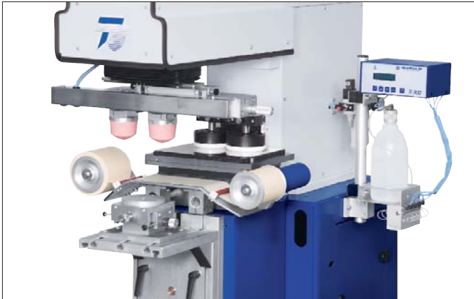
Verschiebetisch VT 602 und Koordinatentisch KT 50 an TPX 200 Shuttle table VT 602 and coordinate table KT 50 on a TPX 200